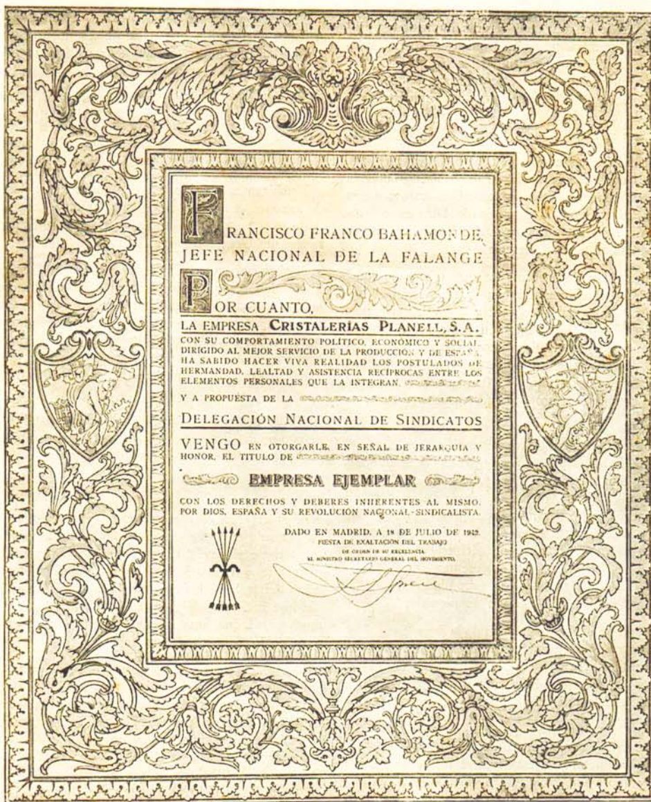
Título de "EMPRESA EJEMPLAR" con el que el Caudillo nos honró el día 18 de julio del corriente año, fiesta de la Exaltación del Trabajo.