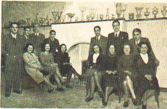
Componentes del "Cuadro Escénico" en la Sala de Descanso y Ensayos

Representó con toda propiedad la obra de Adolfo Torrado la Madre Guapa con el siguiente reparto: