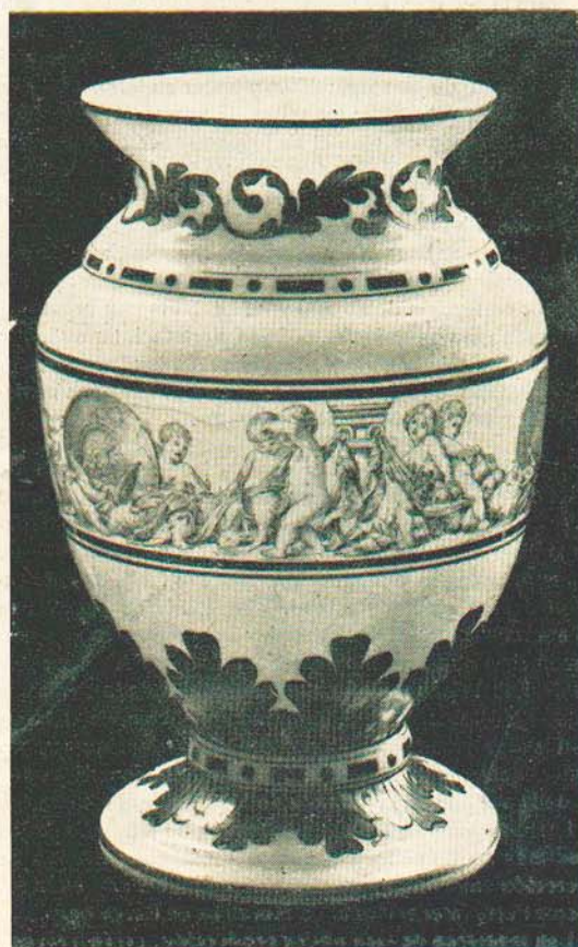
Jarrón opal, estilo Renacimiento italiano, decorado con dibujo a pluma y adornos en oro mate

Nuestros talleres llenos de la luz y del oro del sol contribuyen al bienestar de esas horas creadoras, convirtiéndolas en el santuario donde nuestra inspiración se mejora y estimula.