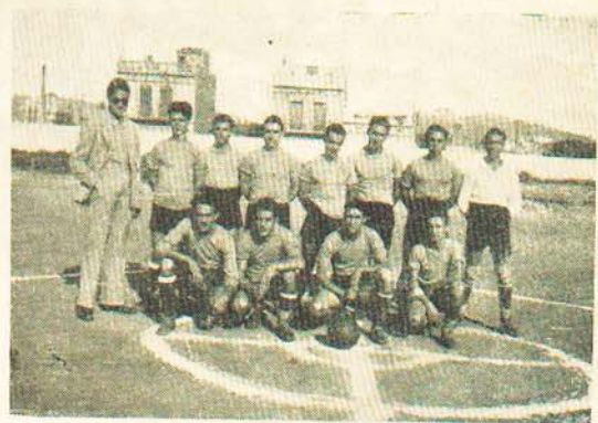
El equipo de Foot-Ball que ganó la Copa disputada el día 24 de septiembre

Se han adquirido lotes importantísimos de libros para la biblioteca y se ha recibido una colección completa, mag-